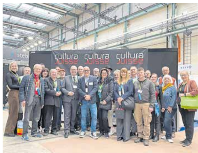
Die sächsische Reisegruppe auf der Schweizer Fachmesse für Denkmalpflege, Museen und Kulturerbe.