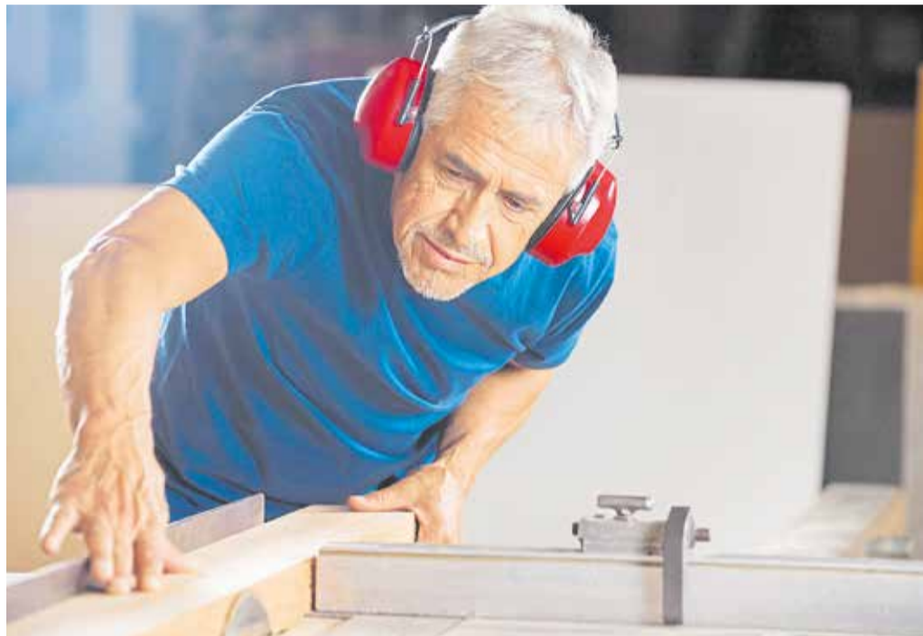
Entspannung: Sowohl die Bauhauptbetriebe als auch die Ausbaugewerke verzeichnen spürbare Verbesserungen bei der Auftragslage.

Sowohl die Bauhauptbetriebe als auch die Ausbaugewerke verzeichnen spürbare Verbesserungen bei der Auftragslage. „Der Bau rettet uns in diesem Quartal