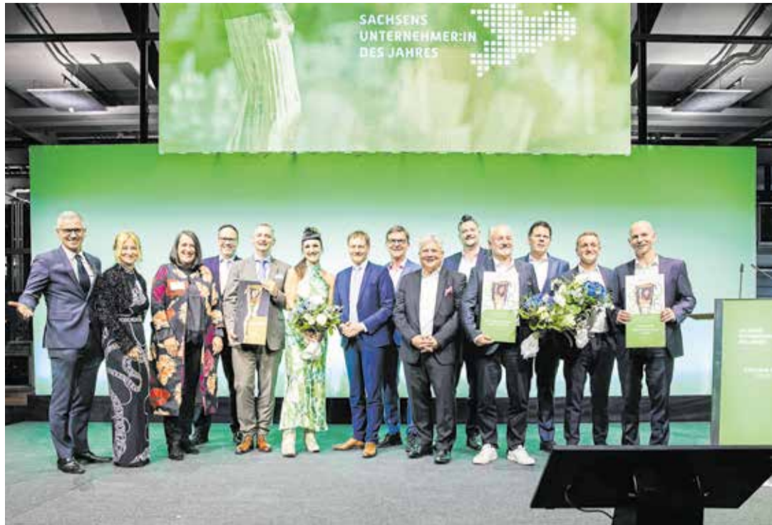
Die Jury mit den Top 3 im Wettbewerb um „Sachsens Unternehmer:in des Jahres 2026“.